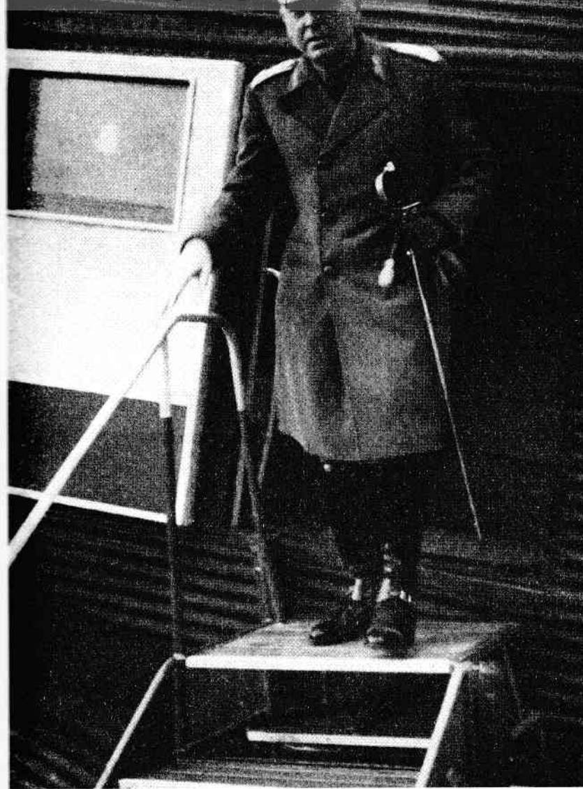
Mareșalul coboră din avion la Viena